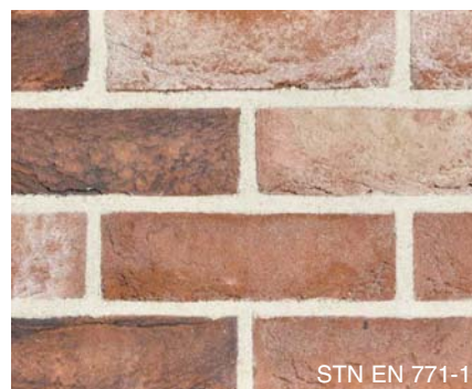
STN EN 771-1