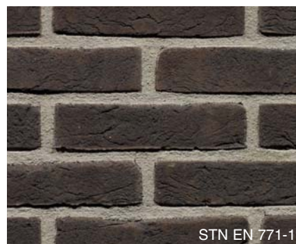
STN EN 771-1