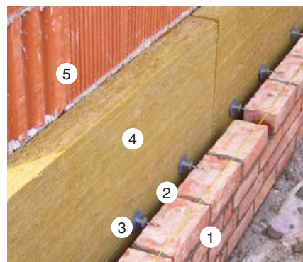
Skladba vrstiev obvodovej steny s prevetrávanou vzduchovou medzerou