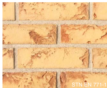
STN EN 771-1