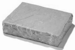
Old Town schod 46 x 35,5 x 10 cm