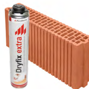
Porotherm 10 Profi Dryfix