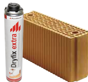
Porotherm 14 Profi Dryfix