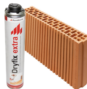
Porotherm 8 Profi Dryfix