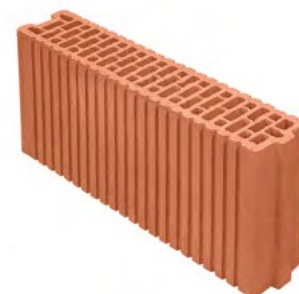
Porotherm 10 Profi